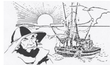
Sassnitzer und Rostocker Hochseefischerei der ehem. DDR

Bitte nachfolgende WebSites als WebLinks einbauen: