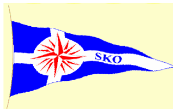
„Segelkameradschaft Ostsee e.V.“ (Erhalt des 12ers ANITA)