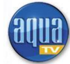
„Aqua TV“ (Internet-Wassersportmagazin)