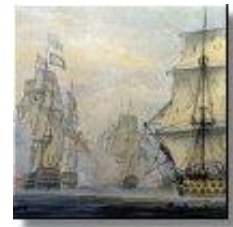
„Line of Battle“ (Seekrieg gegen Napoleon)