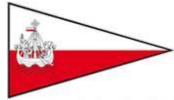
„Museumshafen Lübeck e.V.“ (Traditionschiffe in Lübeck)