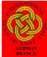
„International Guild of Knot Tyers“ (Gilde der Knotenmacher)