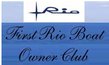
„Rio Boat Club“ (Klassische „Rio“-Motorboote)

Nachfolgend einige Links zu Personen, Organisationen und anderen, mit denen uns ein gleiches Ziel verbindet: der Erhalt des maritimen Kulturgutes in unserem Lande.