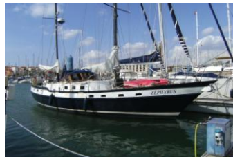
„suncoast project“ (Restaurierung einer Ketsch)