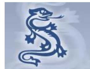
„Das Deutsche Drachengeschwader e.V.“ (Vereinigung der Drachenboote)