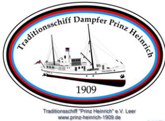
„Traditionschiff PRINZ HEINRICH, 1909“ (Erhalt eines Dampfschiffes)