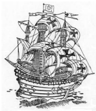
„TimeDesign“ (DIE Liste für Schiffsnachbauten)