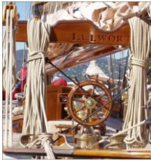
„Gerhard Standop“ (Architekt und Photograph)