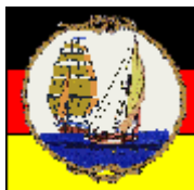
„mini-sail e.V.“ (Modellbauverein)